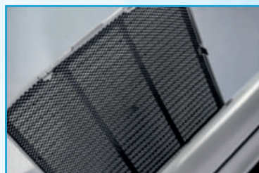
Filtro de carvão ativado