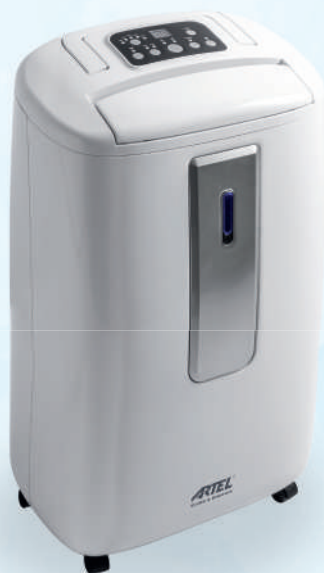
TABELA DE ESPECIFICAÇÕES