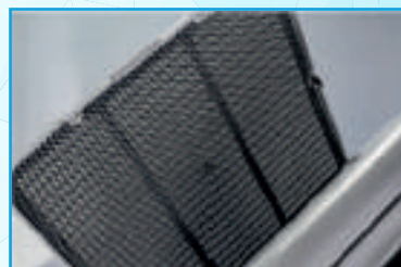
Filtro de carvão ativado